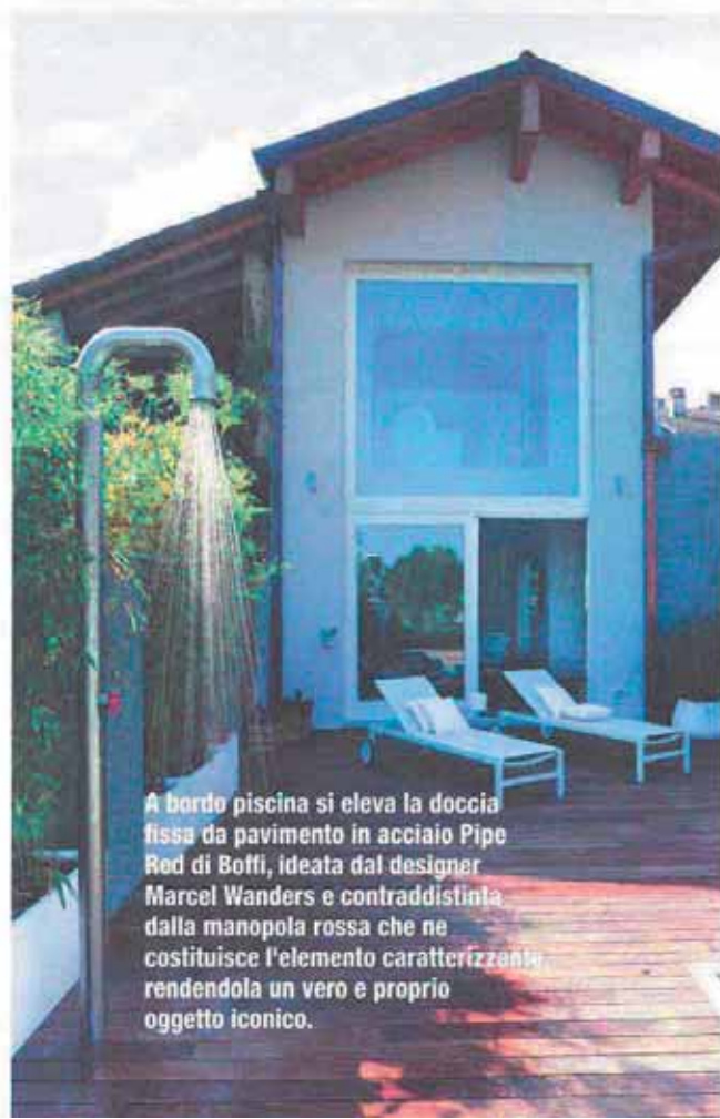
A bordo piscina si eleva la doccia fissa da pavimento in acciaio Pipe Red di Boffi, ideata dal designer Marcel Wanders e contraddistinta dalla manopola rossa che ne costituisce l'elemento caratterizzante rendendola un vero e proprio oggetto iconico.